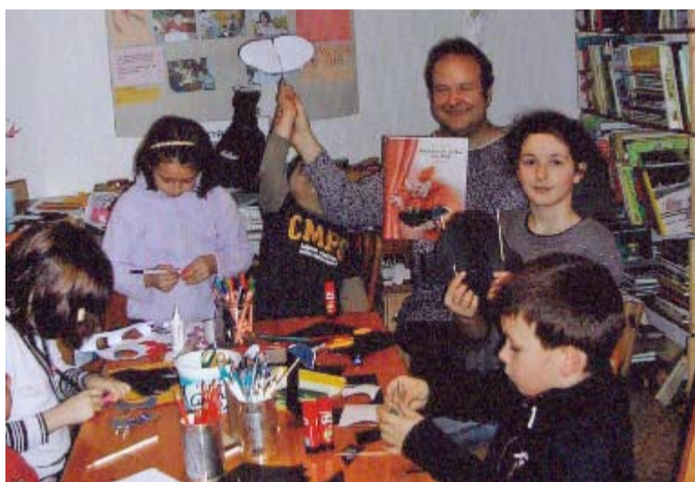
Im Kindertreff Basel