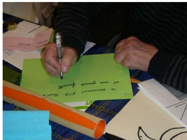
Schreibatelier an einem Familientreffen in Treyvaux