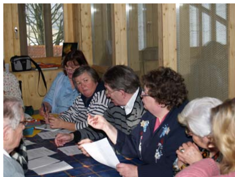
Arbeitsgruppe an der Volksuniversität Vierte Welt

...Sie machen uns auf die dringende Notwendigkeit, die gemeinschaftlichen Werte der Begegnung, des Teilens und der Solidarität wieder-zufinden, aufmerksam... Peter Bieri, Ständeratspräsident, am 17. Oktober 2007 in Bern