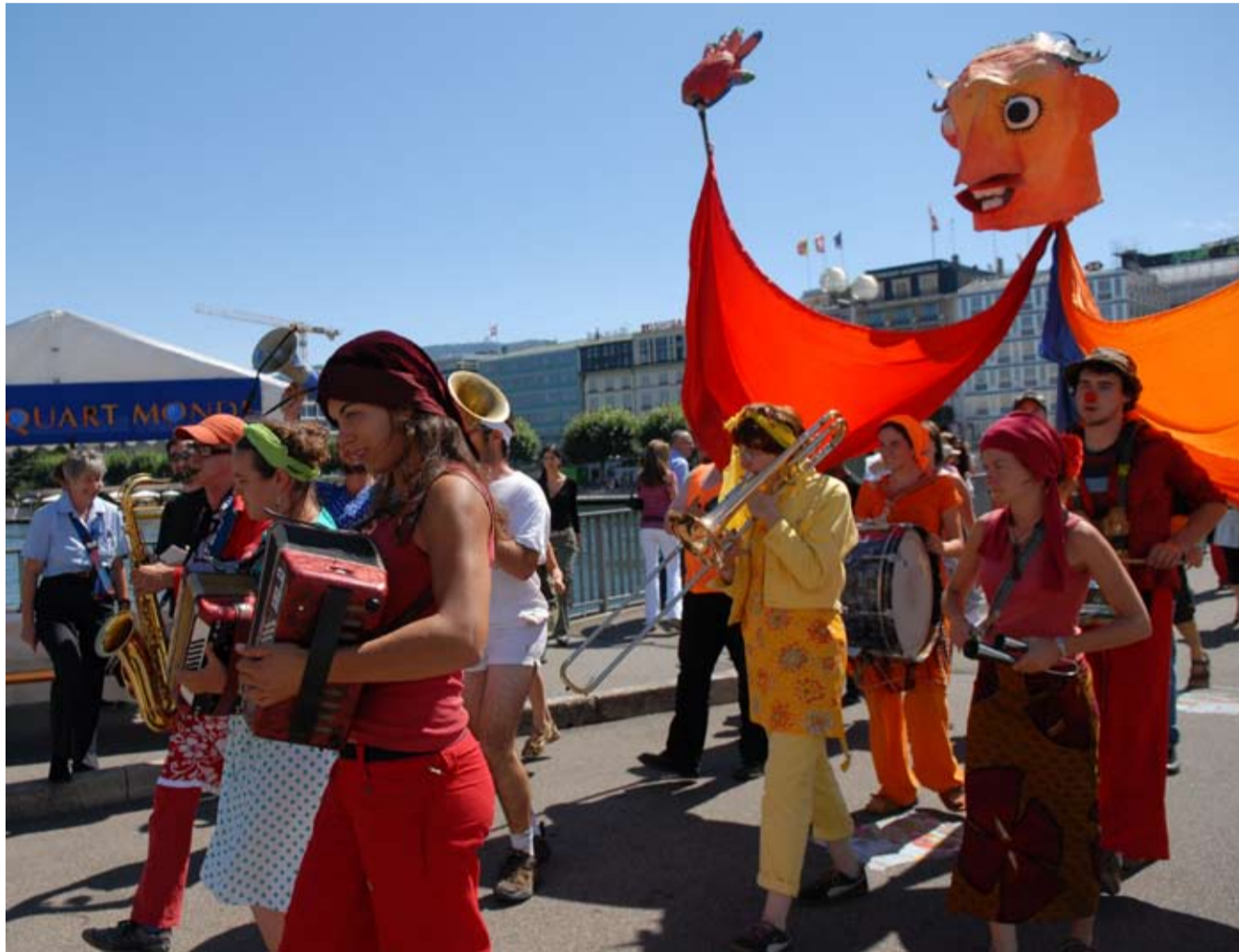
August 2007 Die europäische Jugend- karawane zieht durch die Stadt Genf und lädt zum Fest ein.

In die gleiche Richtung geht die auch von ATD Vierte Welt initiierte Ausarbeitung einer nationalen Strategie gegen die Armut. Mitglieder unserer Bewegung sind daran beteiligt. Es geht darum, nicht nur den Handlungsbedarf zu bestimmen, sondern auch die Perspektiven der Armutsbetroffenen selber in die Lösung der Probleme einzubringen. Denn es muss gelten: die Armen können Teil der Lösung sein, sobald ihr eigener Beitrag zu einer menschenwürdigeren Gesellschaft anerkannt wird.